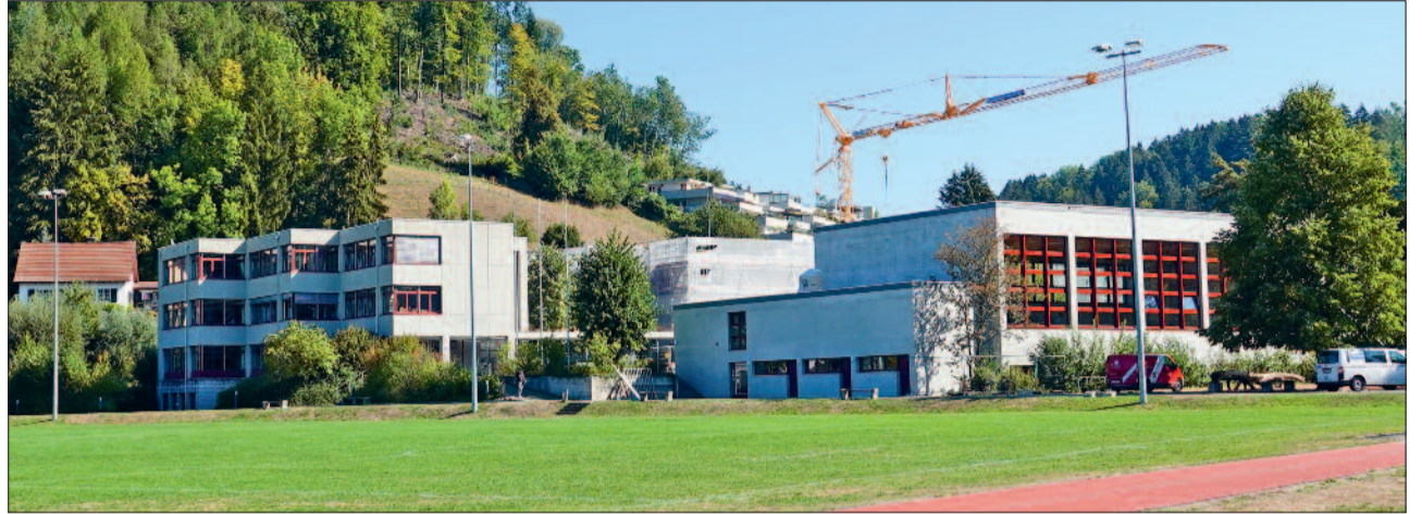
Spätestens Ende Jahr wird die sanierte Färberacker-Schulanlage wieder zur Verfügung stehen.

Die Turnhalle wird nach den Herbstferien wie geplant wieder benutzt werden können. Die Belegung durch die Schule und die Vereine wird von der Schulpflege koordiniert. Der Einzug in die Schulräume wird nach heutigen Erkenntnissen spätestens bis Ende Jahr stattfinden. Demzufolge wird die Schule ihrer «Schlupfbude» für weitere drei Monate treu bleiben müssen.