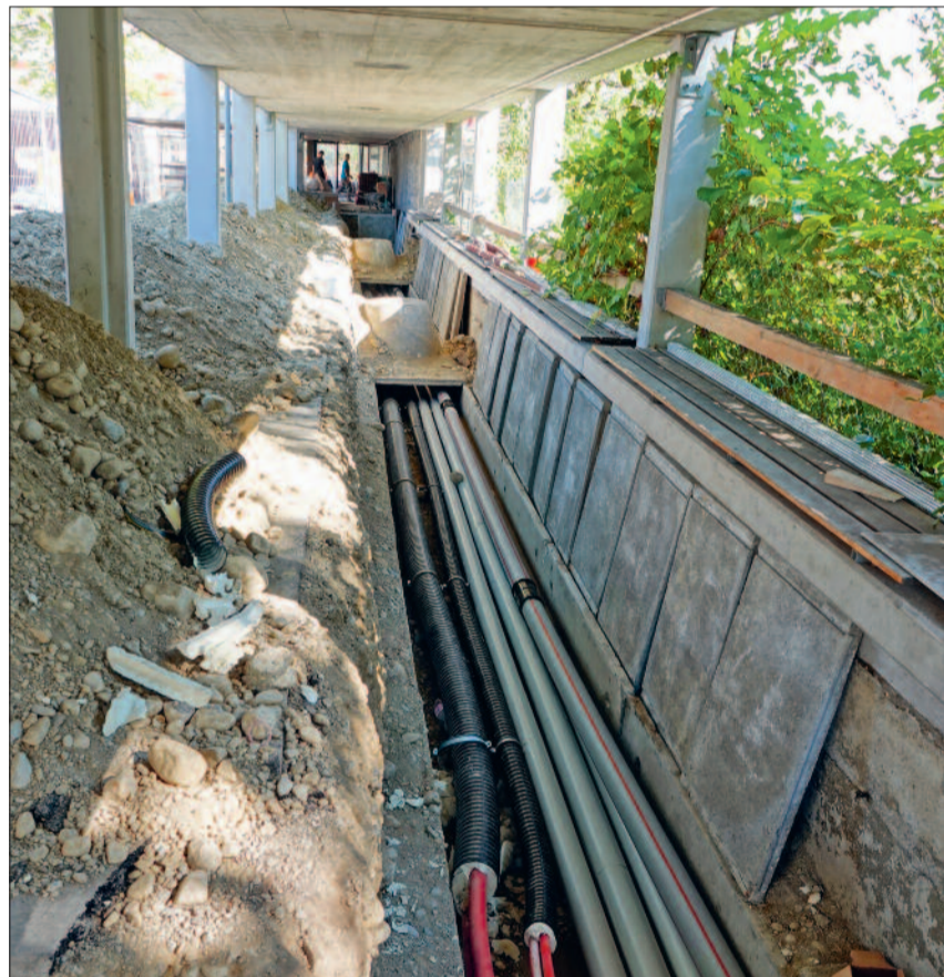
Die umfangreichen Sanierungsarbeiten werden sorgfältig ausgeführt.