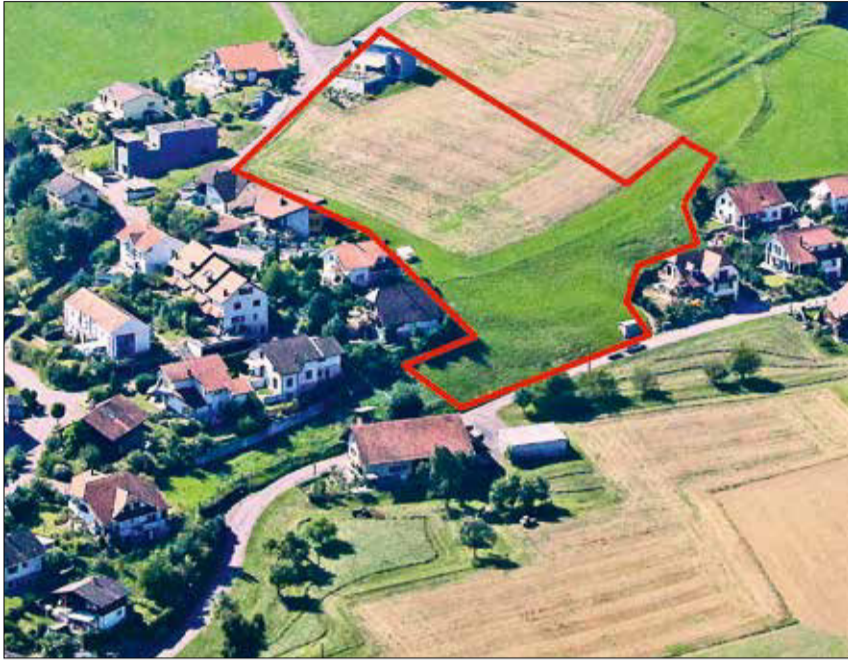
An guter Lage in der Binzhalde bauen.

Die Gemeinde Unterkulm bietet Bauland an attraktivster Wohnlage im Wynental zum Verkauf an. Junge Familien, die sich in Zukunft Rigi und Titlis als Nachbar wünschen, haben die Möglichkeit, sich um eine Baulandparzelle zu bewerben.