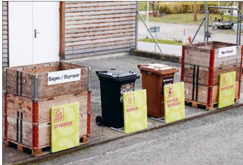
Richtiges Entsorgen generiert Wertstoffe und schont die Umwelt.

Der Gemeinderat verpflichtet sich in seinem Leitbild, sich für eine umweltgerechte Entsorgung von Siedlungsabfällen einzusetzen und dabei die Bedürfnisse der Bevölkerung zu berücksichtigen. Dafür wurde das bestehende Entsorgungsangebot erweitert. Neu werden in der zentralen Abfallsammelstelle beispielsweise