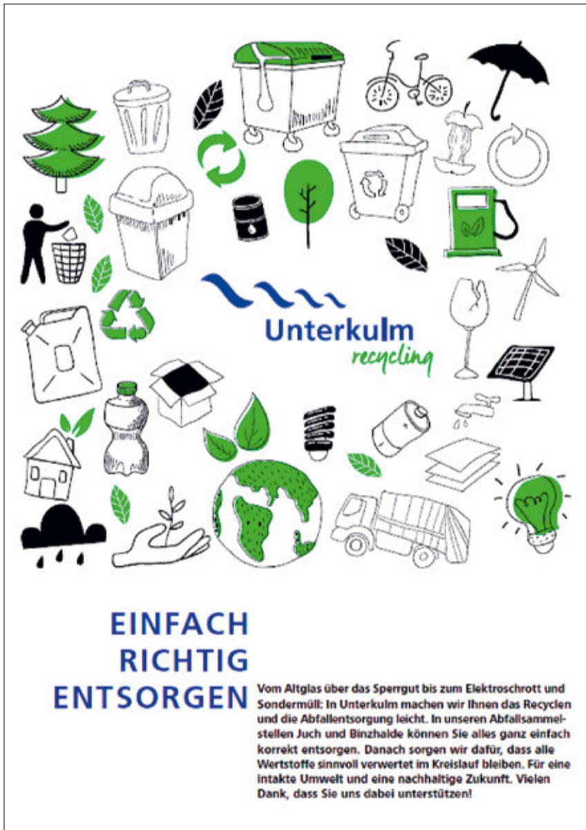
Die neue Broschüre ist bei der Gemeindeverwaltung ab sofort erhältlich.

Die Mitarbeitenden des Technischen Betriebes und der Abfallsammelstelle beraten Sie gerne bei Entsorgungsfragen. Damit Sie sich selbst über die neuen Entsorgungsmöglichkeiten vor Ort ein Bild machen können, laden wir Sie herzlichst zum «Tag der offenen Sammelstelle» ein am Samstag, 6. April, von 9 bis 12 Uhr . Geniessen Sie ein offeriertes Kafi und Gipfeli und besichtigen Sie unsere zentrale Abfallsammelstelle im Juch.