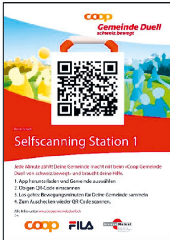
Beispiel einer QR-Selfscanning-Station

dem Konto des Teilnehmenden gutgeschrieben.