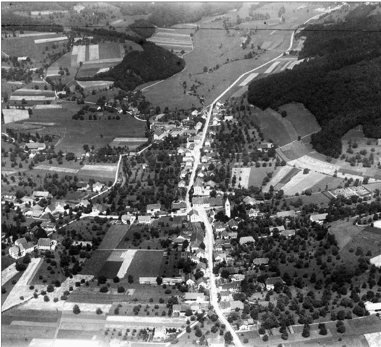
Luftaufnahme von Unterkuhlm aus dem Jahr 1923.

An der Gemeindeversammlung vom 16. Mai 2019 entscheiden die Unterkuhlmerinnen und Unterkuhlmer über die Totalrevision der Bau- und Nutzungsordnung. Mit dem Entscheid wird die raumplanerische Entwicklung der Gemeinde für die nächsten 15 Jahre festgelegt. Zu genehmigen sind die neue Bau- und Nutzungsordnung, der Bauzonenplan, der Kulturlandplan und der Hochwasserschutzplan.