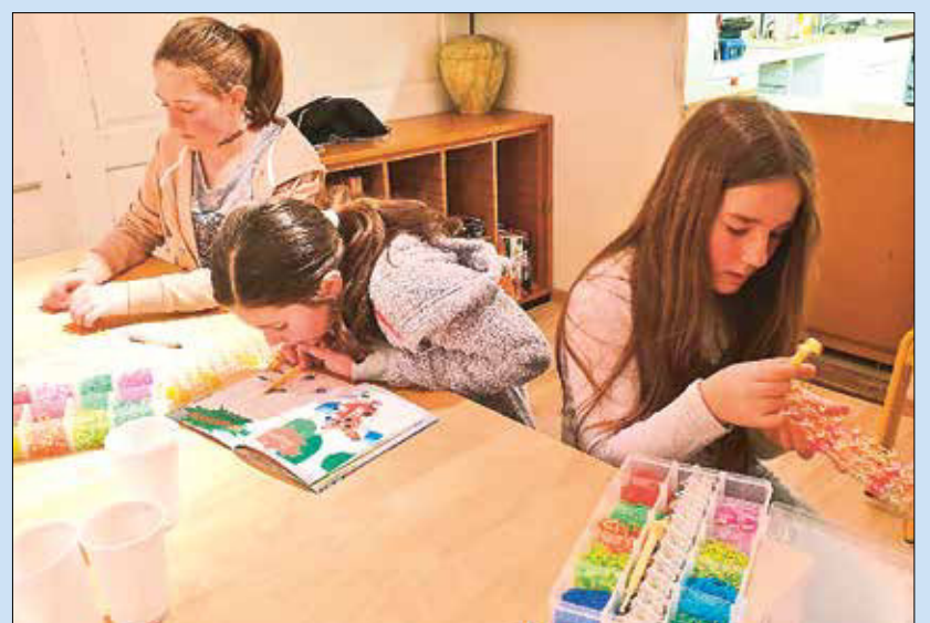
Konzentriertes Basteln von Modeschmuck.