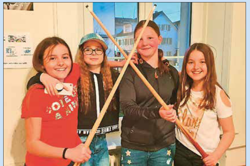
Spiel und Spass beim Mädchentreff in Unterkulm.

Nach einigen Startschwierigkeiten boomte der Mädchentreff die letzten beiden Monate förmlich. Rund 25 Mädels waren pro Abend anwesend.