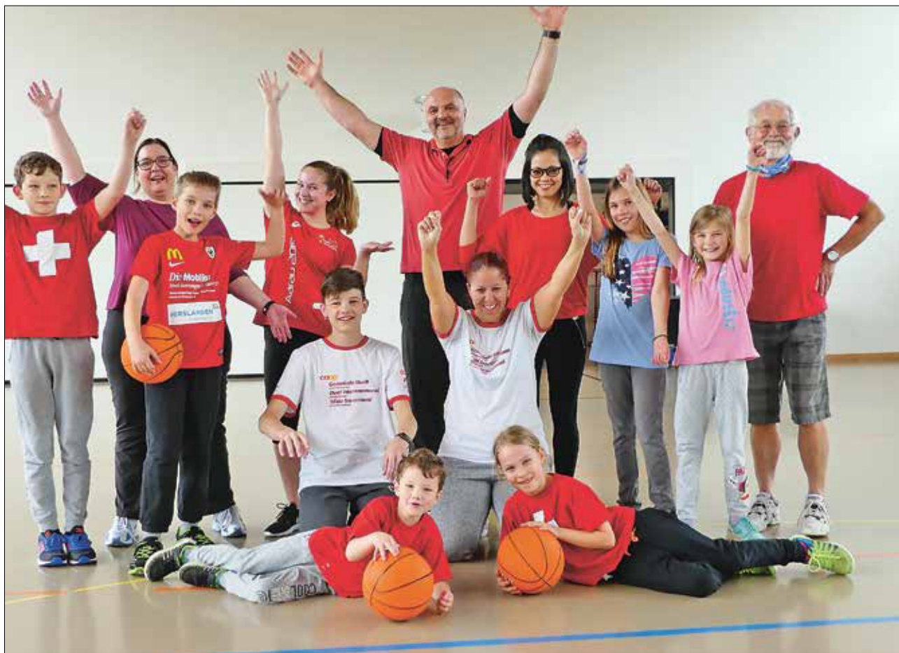
Eine kleine, aber motivierte Gruppe.

Im Rahmen der «grössten Turnstunde der Schweiz» war die Unterkulmer Bevölkerung am vergangenen Sonntag aufgerufen, sich an einer gemeinsamen Turnstunde für die Aktion «Unterkulm bewegt» zu beteiligen.