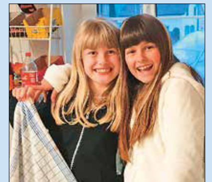
Gemeinsames Kochen – und Aufräumen.

Am ersten Abend im März fand eine «Kennenlernrunde» statt. Gemeinsam besprachen wir, was künftig im Mädchentreff laufen soll. Gemeinsam kochen, tanzen, singen, Bowling, Lasertag und vieles mehr wurde gewünscht und wird nach Möglichkeit auch umgesetzt. Später am Abend tanzten die Mädels ausgelassen zu lauter Musik oder spielten Videospiele im Zimmer nebenan.